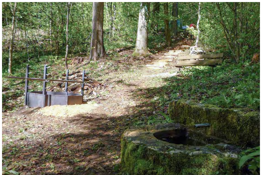
Das Resultat ist sehenswert!