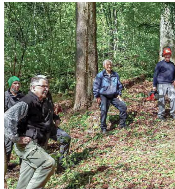
Die No. 33 und 34 (Bänkli und Feuerstelle) bezeichnen den Standort.