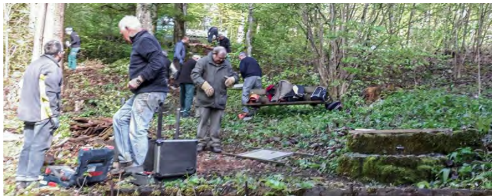
Die Grillstelle wurde erneuert.