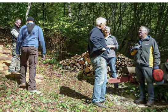
Bäume wurden gefällt, Sträucher geschnitten, Tisch und Bänke zugänglicher gemacht.